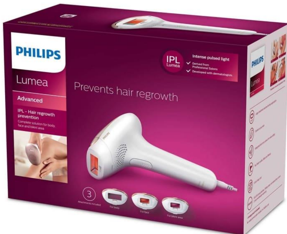
Philips Lumea Advanced je dodáván v malé, elegantní krabici.